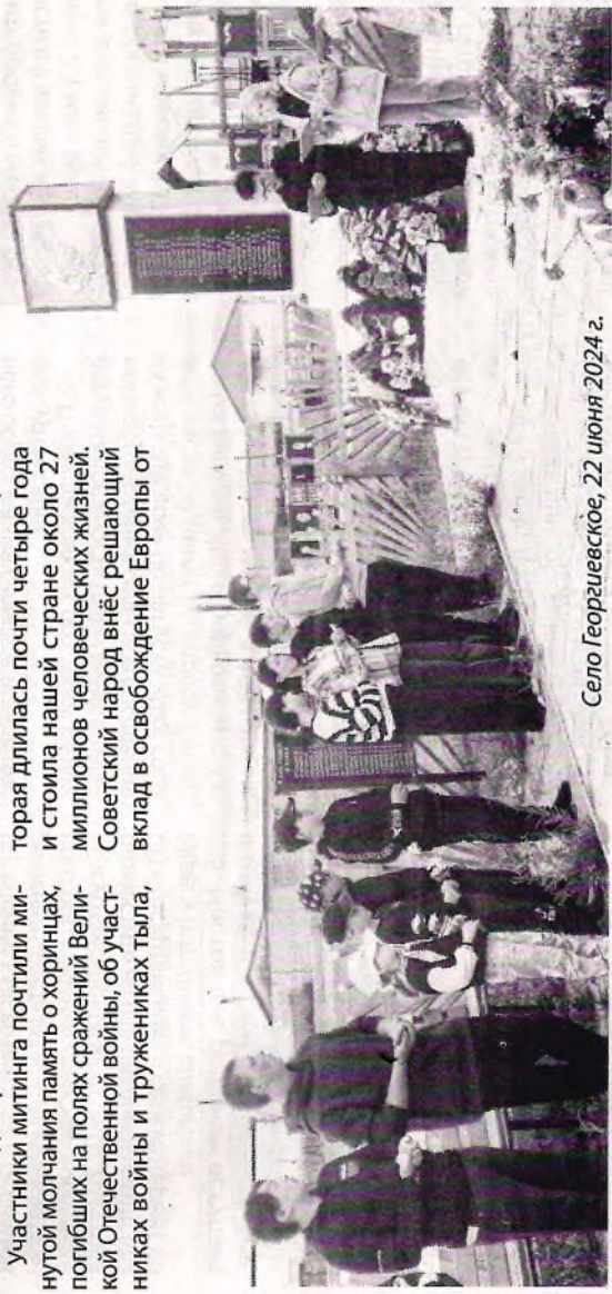
Село Георгиевское, 22 июня 2024 г.

Возможны изменения расценок в зависимости от качества бумаги и формата.