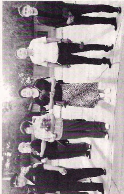
Минута молчания в селе Хоринск.

умерших в мирное время. Хоринцы возложили цветы к памятнику воинам-землякам и зажгли свечи.